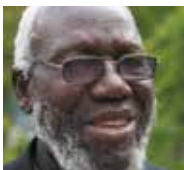
Paride Taban, Biskop emeritus, Holy Trinity Village of Kuron, South Sudan