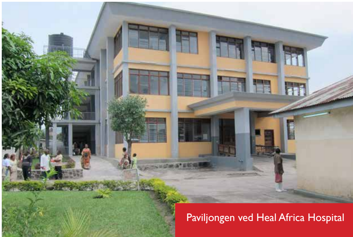
Paviljongen ved Heal Africa Hospital